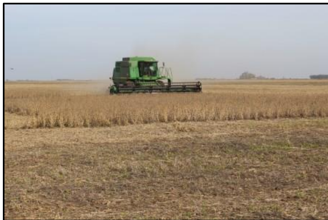
Cosecha soja de primera. Carlos Tejedor, Bs. As. (12-05-15).

A nivel nacional, aún falta recolectar poco menos de 4 MHa, ubicadas en su mayoría sobre el extremo norte y sur del país, en las regiones NOA y NEA y gran parte de la región bonaerense. Según nuestro informe climático se prevén lluvias de dispar intensidad para los próximos días, que podrían concentrarse sobre el margen este de la región agrícola y provocar interrupciones transitorias en la cosecha en Chaco, Santa Fe, Entre Ríos y sectores de Buenos Aires.